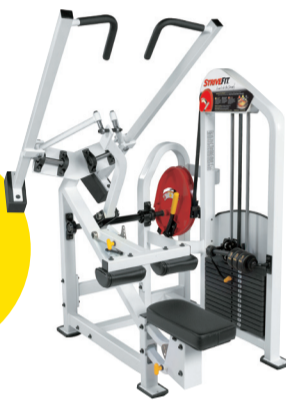
ラットプルダウン