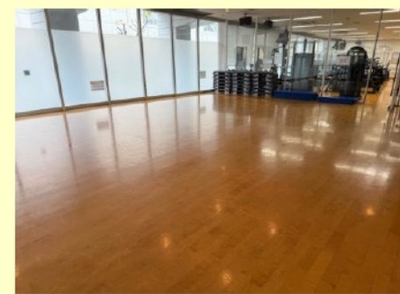
広大なスタジオでゆったりと ストレッチも可