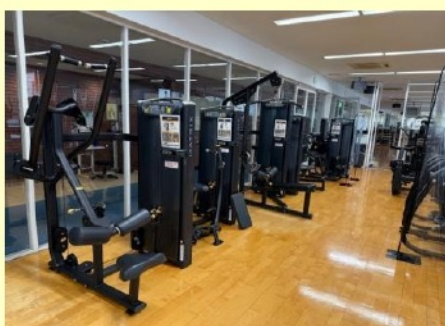
トレーニング初心者でも 使いやすいマシン群