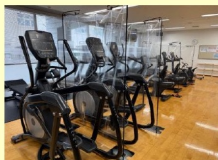
ステップやアップライト リカンベントバイクも充実